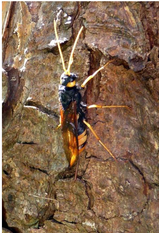
Stor Træhveps – helt ufarlig selv om den prøver at ligne den Store Gedeham

Når de forlader træet efter nogle år som larver, efterlader de et hul, som de enlige vilde bier kan udnytte som reder for deres larver.