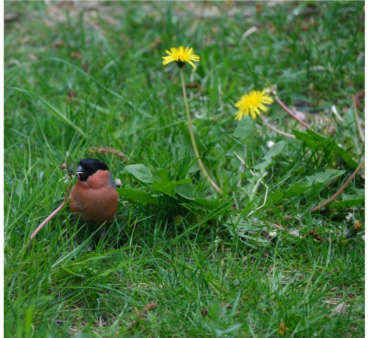
Glad for at fotografere...