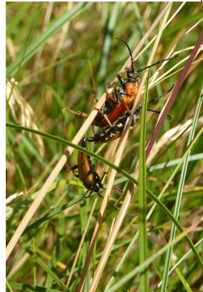
Rød Blomsterbuk – hun og to hanner. Larverne lever i dødt fyrre- eller grantræ.